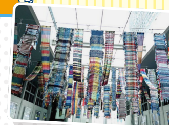
Saori VIEW in Kawasaki Sta. (2022) JR川崎駅北口

だれもがすぐにできてたのしめる、自由なスタイルの織物「さをり織り」。障がいのある・なしにかかわらずだれもがアートをたのしめる社会を目指すstudio FLATのアーティストがつくった、個性あふれる「さをり織り」の作品を展示するよ!